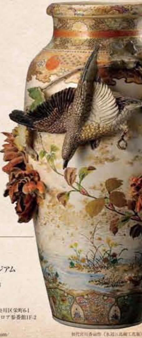
初代宮川香山 眞葛焼(赤・青・黒釉花瓶)

宮川香山 眞葛ミュージアム 開館日 土曜日・日曜日のみ開館 開館時間 10:00~16:00 入館料 500円 住所 〒221-0032 横浜市神奈川区栄町64-1 電話番号 045-534-6853 URL http://kisan-makura.com/