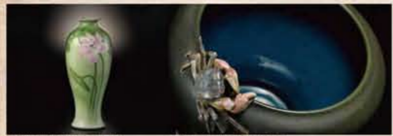
初代宮川香山 眞葛焼(緑釉花瓶) 初代宮川香山 眞葛焼(青釉鉢)

四代目香山による復興もむなく、その歴史の幕は閉ざされ、今では“幻のやきもの”と呼ばれるようになりました。現在弊社では、地域への文化貢献の一環として「宮川香山 眞葛ミュージアム」を運営し、横浜の大切な歴史・文化である眞葛焼を守り、伝えていきます。また「MONTE ROSA」店内にも選りすぐりの作品を展示しておりますので、是非ご覧ください。